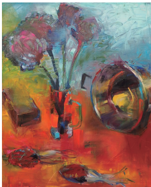
静物油彩 F15号 「ドライフラワー、バケツ、レンガ他」

油画や日本画、版画といった学科を目指すコースです。水彩絵具、油絵具や木炭などの基本的な使い方を学びます。まずは道具になれること。絵を描くことを楽しみながら、専門的な知識や技術を学んでいきましょう。