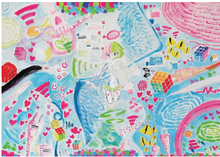
イラストレーション 四つ切り 「自分自身をキャラクター化して表現する」

美術高校を目指す人、もう少し本格的に美術を学んでみたい中学生を対象にしています。1日3時間、集中して描くことで、基礎力を身につけます。