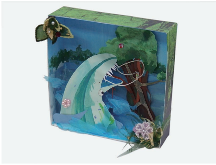
立体造形 ボックスアート 「物語の1シーンを箱の中に表現する」

美術で一番大切なのは「楽しむこと」。楽しむ才能は誰にでもあるはず。頭に浮かんだモノを形にする。こんな楽しいことは他にありません。自分だけの作品を自分の手で。さあ、始めてみましょう。