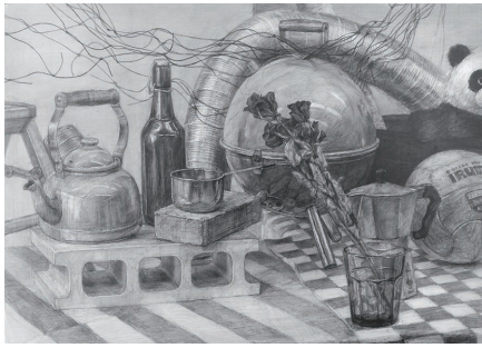
静物デッサン B2 「ヤカン、ボトル、ドライフラワー他」

デザインと工芸に必要な3つの技を身につけよう。それはデッサン力、構成力、色彩の使い方。時間をかけてじっくり制作します。わからないことは気軽に質問してください。自分の力を磨いていきましょう。