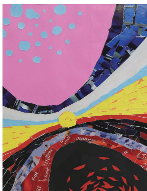
コラージュ 木炭紙大 「イメージ表現」

映像・メディア、アニメーションといった学科の入試に対応したコースです。鉛筆デッサン、コラージュ、水彩と様々な技法に取り組みながら、道具の使い方など基礎の基礎から始めて、発想力を高めていきます。