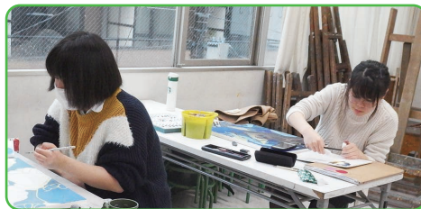
春期講習会授業風景